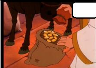
José pediu que colocassem a prata em cada bagagem.

2. Numere as cenas de 1 a 4 na ordem em que ocorreram ( Gênesis 42.12-26 ):