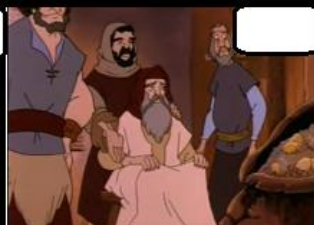
Retornaram a Canaã, contaram tudo a Jacó.