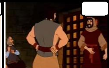
Eles ficaram presos durante três dias.

3. José ordenou que lhes dessem trigo e devolvessem a prata de cada um deles, e ainda que dessem mantimentos para a viagem. E assim foi feito sem os irmãos de José saberem de nada. Desenhe o que se pede: