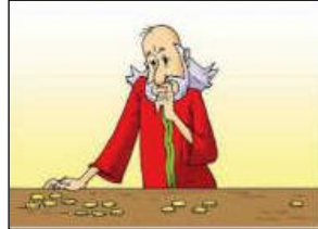
Senhor dos servos