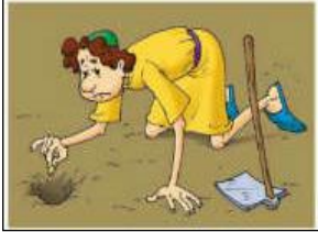
Servo que recebeu um talento