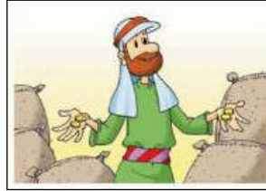
Servo que recebeu 2 talentos