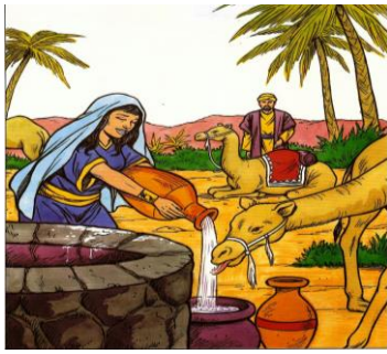
Deu água para Eliezer e os camelos