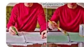
Eu lendo a Bíblia e marcando as partes em que Deus falou comigo:

Pense Nisso!!! Sabe aquela preguiça de meditar, aquela voz que lhe diz para você assistir mais um vídeo no YouTube, mais um capítulo daquela série e que você meditará depois, mas depois você estará muito cansado... Adolescente, saiba que aquela voz é o Diabo unido a sua preguiça, lutando para afastá-lo de Deus, para tornar você um perdedor. Não os escute! Lembre-se do que a Palavra diz em I Pedro 5.8 " estejam alertas e vigiem. O Diabo, o inimigo de vocês, anda ao redor como leão, rugindo e procurando a quem possa devorar ". Agora identifique seu problema e os vença. Faça um X nas atividades que você faz diariamente e que mais lhe atrapalham de ler a Bíblia e meditar na Palavra: FACEBOOK - NETFLIX - INSTAGRAM - GAMES - TIK TOK .