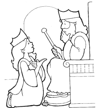
Ester não teve medo de pedir ajuda para o rei.

Falando com Deus: Senhor, eu não quero ser enganado, quero confiar em ti.