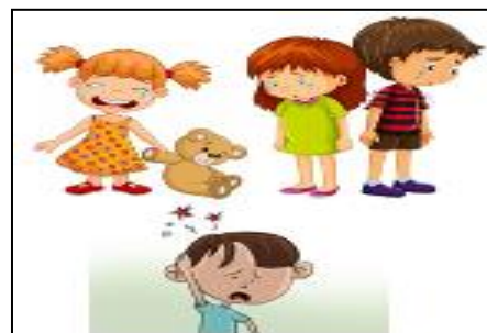
Choro, tristeza e dor