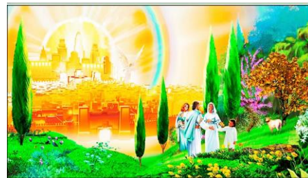
Tudo mudado e mais bonito

Oração - Leia e a criança repete: Deus, eu confio em Ti em todos os momentos.