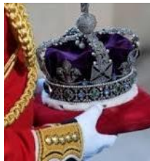
Entregou a coroa

b. O que ele disse para Naamã? Risque as alternativas erradas.