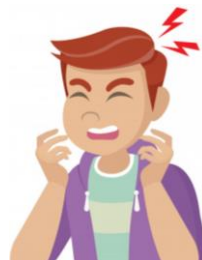
DOR DE DENTE