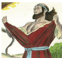
Rasgou as vestes

a. O que rei fez assim que leu a carta? Marque um X na alternativa errada.