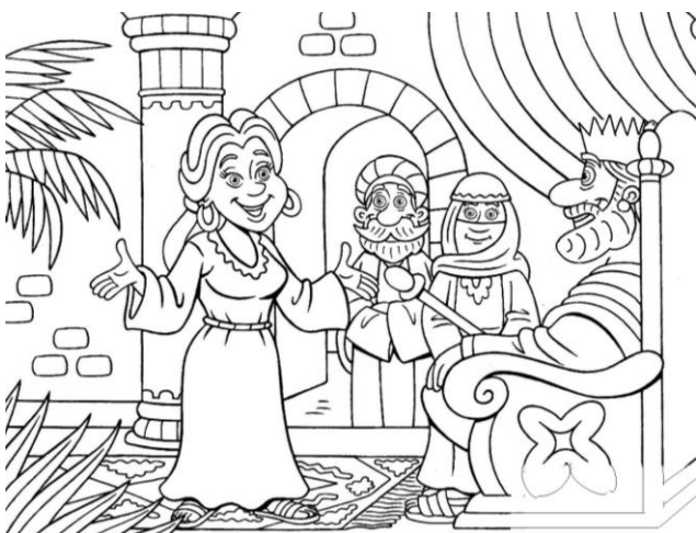
Imagem com 5 erros