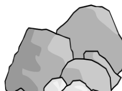
Atrás das pedras