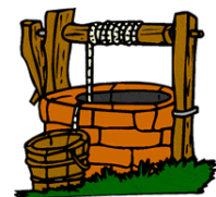
Dentro de poços

4. Samuel já tinha dado ordens para esperar 7 dias até que ele chegasse ao campo de batalha, mas Saul não confiou em Deus e em seu profeta. O medo tomou conta de Saul e ele se descontrolou. Desenrole a frase e descubra o que Deus queria que Saul tivesse feito.